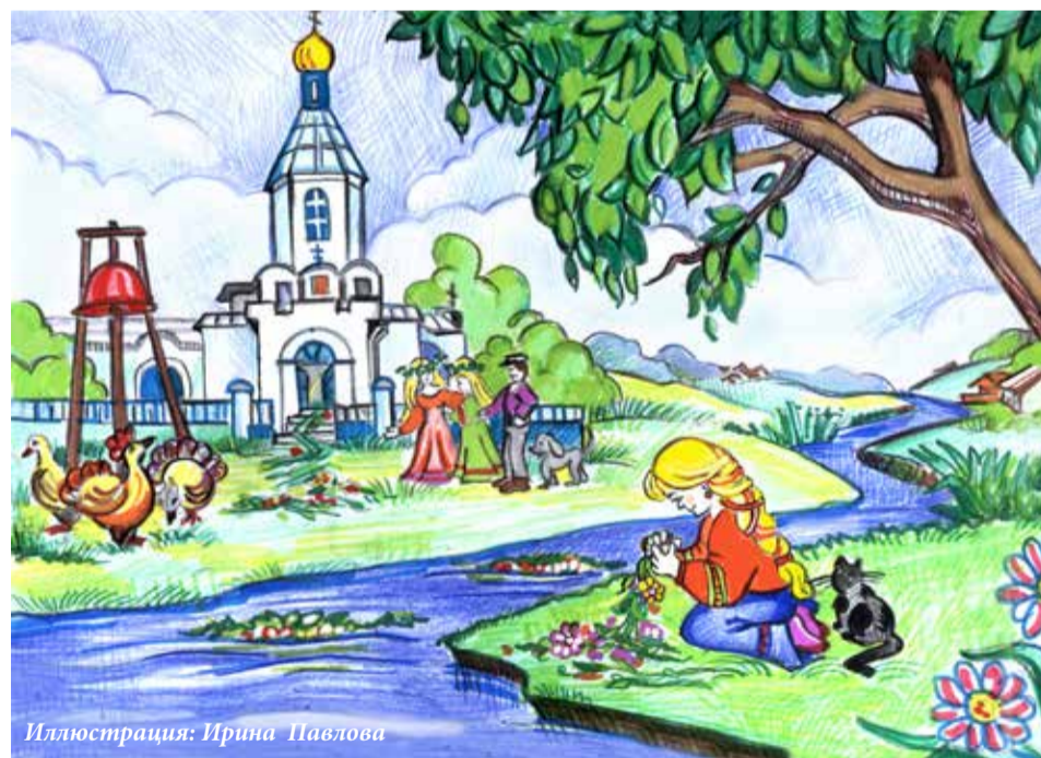
Иллюстрация: Ирина Павлова