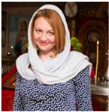
И все-таки я воспользуюсь своим служебным положением!

Я счастлива! 28 мая был мой День рождения. В нашем храме меня чествовали в день Святой Троицы – это самый большой подарок, посланный мне Богом!!! – В официальных печатных изданиях нельзя использовать троекратное восклицание, да простят меня цензоры и критики, но я воспользуюсь, ибо отразить мои эмоции может только газета, эмпатичная из одних только восклицательных знаков!