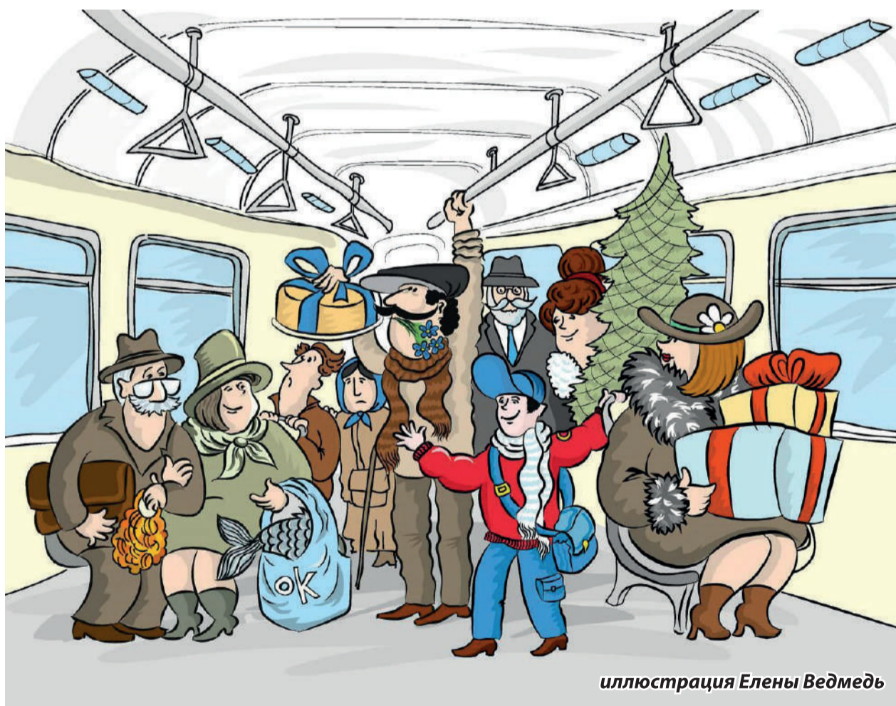
иллюстрация Елены Ведмедь

На страницах – священные тексты и изображения. Пожалуйста, не выбрасывайте газету, отдайте её знакомым или отнесите в храм.